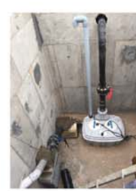
خوزستان - بندر امام