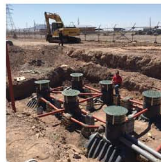
کرمان - شهر بابک