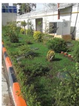
تهران-چاپخانه رسام نگار جاوید