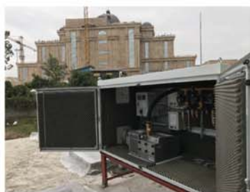
مازندران -اکسن آمل